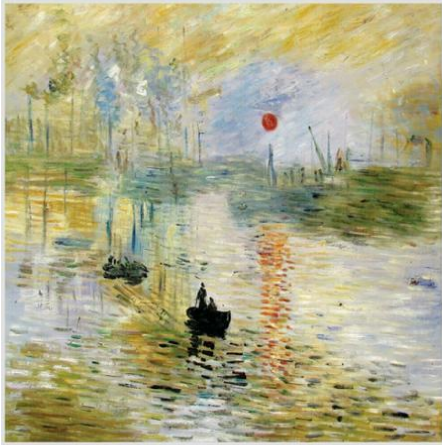
(Impressão, nascer do sol - Claude Monet)