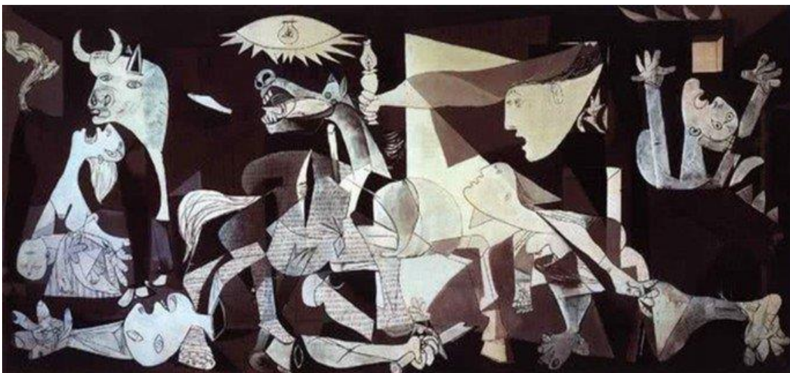
(Guernica - Pablo Picasso)